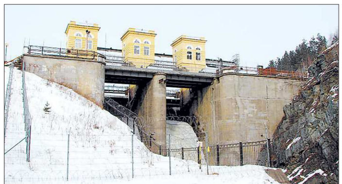
Пруд-охладитель создан как часть БАЭС, а не как курортный объект