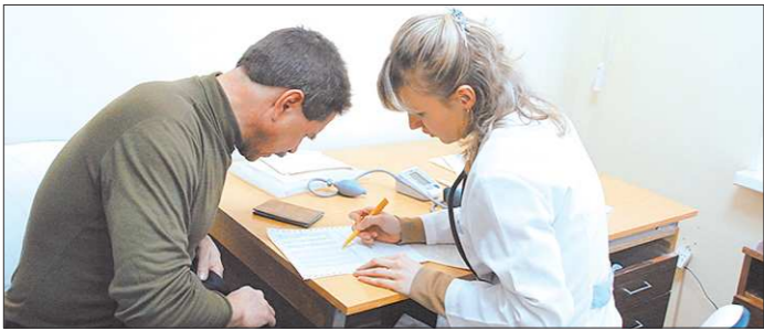
Работающий человек должен уметь, что за один день диспансеризацию не пройдёшь