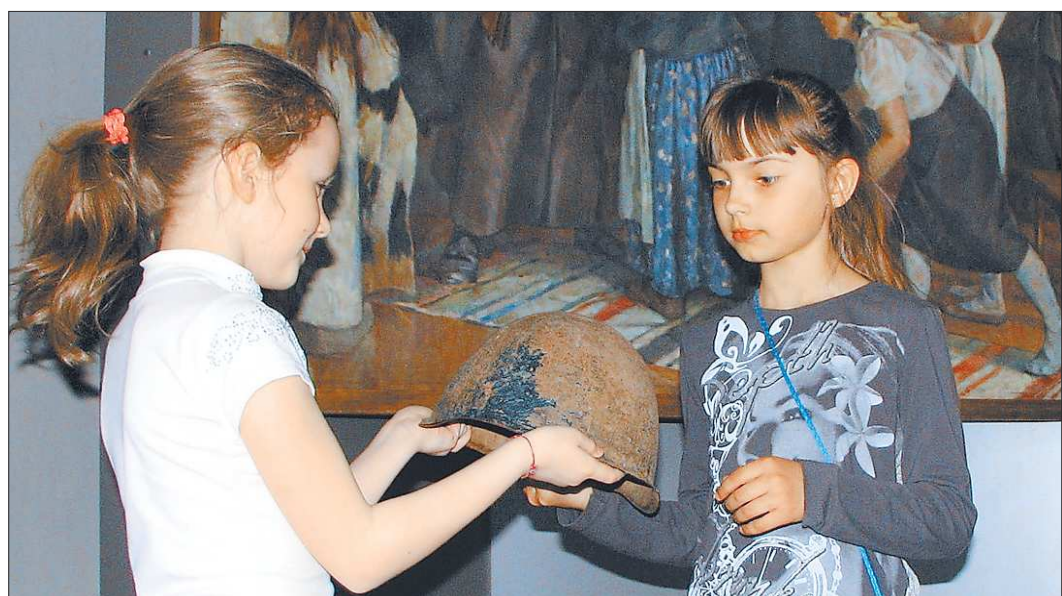
На прошлой неделе музей посетили более 200 салдинцев — рекордная цифра для города с 18-тысячным населением

В работе на агрофирме «Северная» ведётся в соответствии с Трудовым кодексом и действующим законодательством.