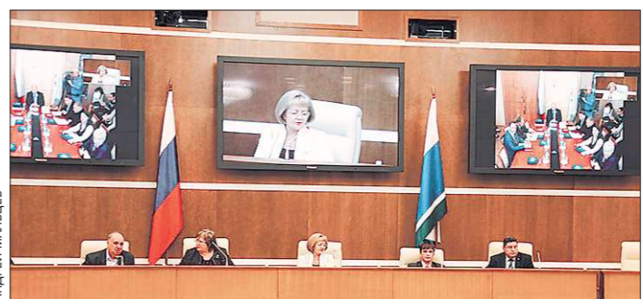
Совещание оказалось очень масштабным: на нём присутствовали и уполномоченные по правам человека, и представители молодёжных правительств, общественных палат

При этом потребность свердловчан в подобных операциях очень велика. Сегодня в листе ожидания записаны примерно шесть с половиной тысяч пациентов.