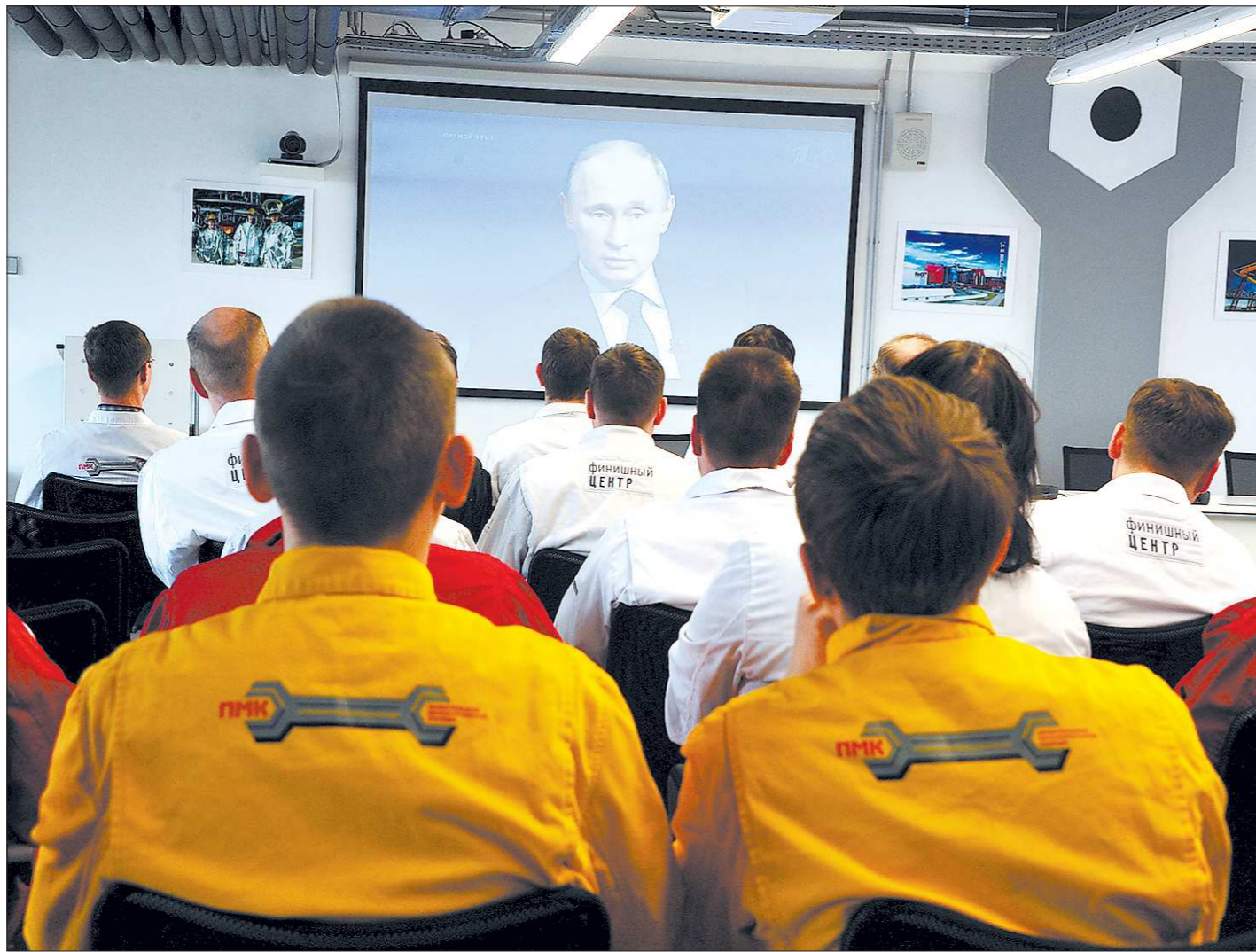
Рабочие Первоуральского новотрубного завода слушали «Прямую линию с Владимиром Путиным» с особым интересом: в московской телевизионной студии присутствовали их земляки

Разумеется, был задан вопрос о борьбе с коррупцией, о деньгах чиновников в зарубежных банках. Президент ответил весьма резко: — Если люди, которые работают в экономической