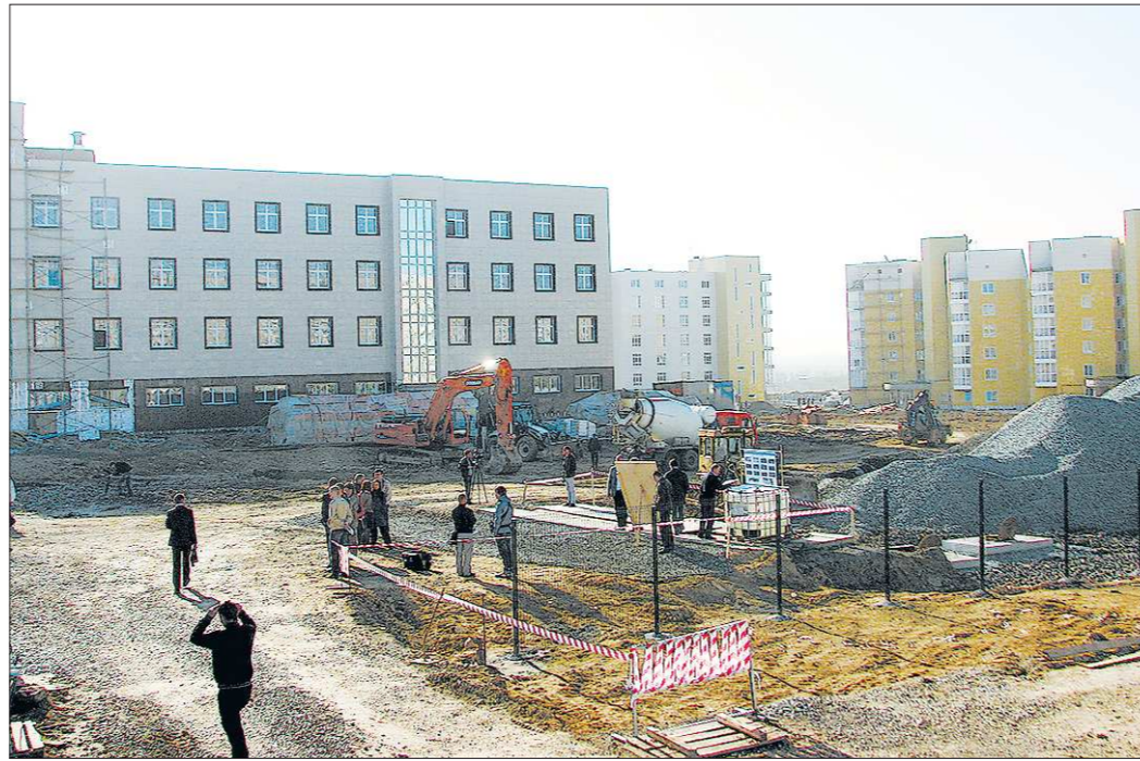
Местные жители, наблюдая, как стремительно растут здания госпиталя, мечтают о таких же темпах на стройке детской больницы, которая возводится двадцать лет

*День тезоименитства — это день памяти какого-либо святого, праздник для человека, который при рождении получил имя этого святого.