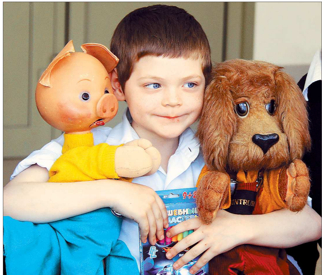
Куклы, которых актёры привезли с собой в Екатеринбург, сохранились со времён советского телевидения, им уже более 20 лет