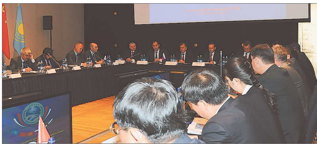
Первый день совещания руководителей погранслужб прошёл в закрытом для журналистов режиме

Сегодня на странице X «ОГ» публикует список лауреатов премии им. Черепановых 2013 года.