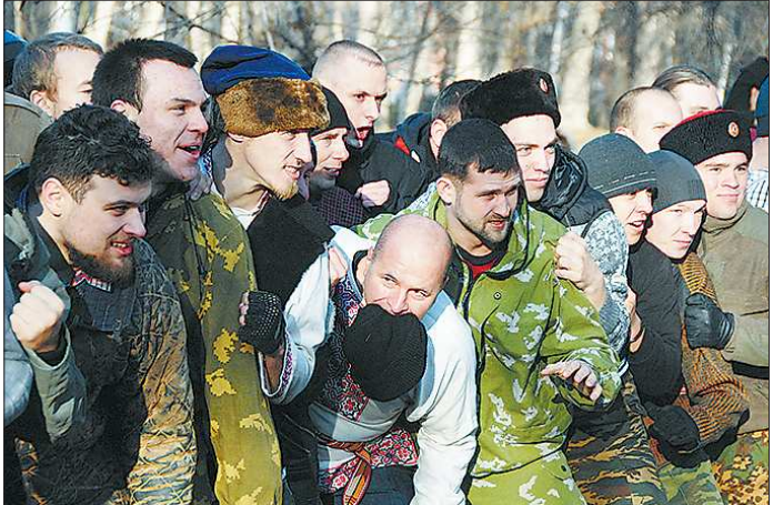
Участники делятся на две команды минимум по 10 человек. Если участников много, стенка строится в три-четыре ряда

У каждой «команды», участвовавшей в «стенке», был предводитель. В разных частях России его называли по-разному: башлык, голова, староста. Накануне боя башлык вместе с группой лучших бойцов разрабатывал план предстоящего сражения: распределял лучшие силы вдоль всей «стены», намечал резервы для решительного удара, иногда выделял своеобразный спецназ, чтобы выбить какого-нибудь опреде-