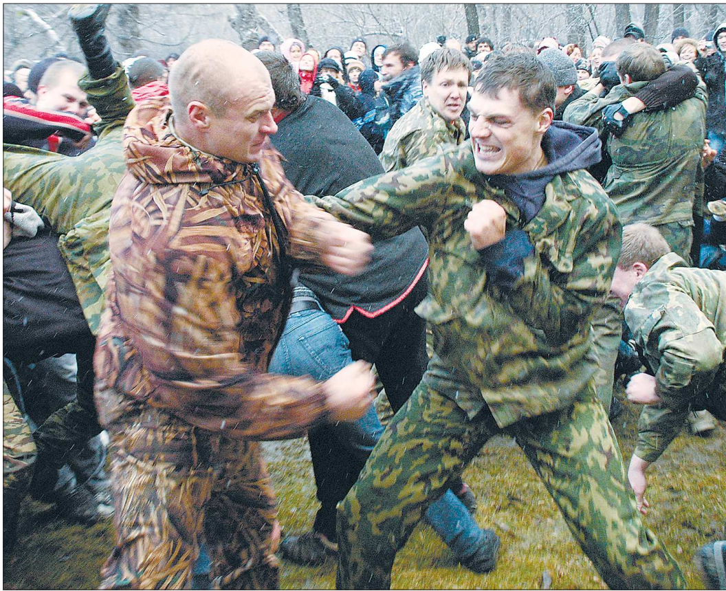
Современные стеношные бойцы из-за недостатка практики строй держат плохо, и «стенка» частично превращается в сцеплялку-свалку