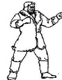
Стойка кулачных бойцов — практически такая же, как у боксёров

Как сходились, собирались Удалые бойцы московские На Москву-реку, на кулачный бой, Разгуляясь для праздника, потешився. И приехал царь со дружиною, Со боярами и опричниками, И велел растянуть цепь серебряную, Чистым золотом в кольцах спаянную. Оцепили место в двадцать пять сажень, Для охотничьего боя, одиночного. И велел тогда царь Иван Васильевич Клич кликать звонким голосом: «Ой, уж где вы, добрые молодцы, Вы потешите царя нашего батюшку! Выходите-ка во широкий круг; Кто побьёт кого, того царь наградит; А кто будет побит, тому бог простит!» И выходит удалой Кирибеевич, Царю в пояс молча кланяется, Скидает с мочуих плеч шубу бархатную, Подпершись в бук роковую правую, Поправляет другой шапку левую. Ожидает он себе противника... Трижды громкий клич прокрикали - Ни один боец и не тронулся, Лишь стоят да друг друга потапливают. На просторе опричник похаживает, Над плохими бойцами подсмеивает: «Присмирели, небось, призадумались! Так и быть, обещаю, для праздника, Отпущу живого с покаянием, Лишь потешу царя нашего батюшку». Вдруг толпа раздалась в обе стороны - И выходит Степан Парамонович, Молодой купец, удалой боец, По прозвищу Калашников. Поклонился прежде царю грозному, После белому Кремлю