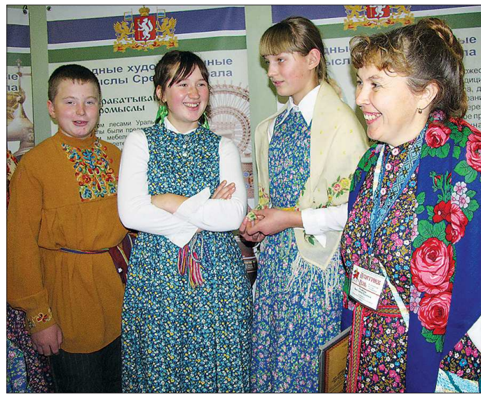
Коллектив «Родники души» собирали из Нижнего Катарача в Екатеринбург на фестиваль всем миром: Талицкий отдел культуры оплатил бензин для автобуса, по 1100 рублей дали родители ребят

Мне казалось, эти простенькие на вид девочки должны чувствовать себя неуютно по соседству с подростками, блестяще экипированными под спортивные балльные танцы (в Центр народного искусства в тот день на другом этаже проходил такой конкурс).