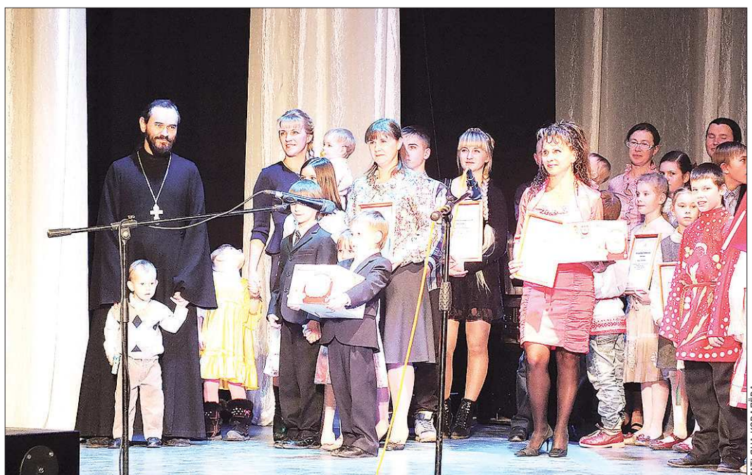
Многодетные семьи, а то и детские дома в полном составе, решили и дальше ходить в госпиталь ветеранов всех войн: кто пирогов для пациентов напечёт, кто песни им споёт