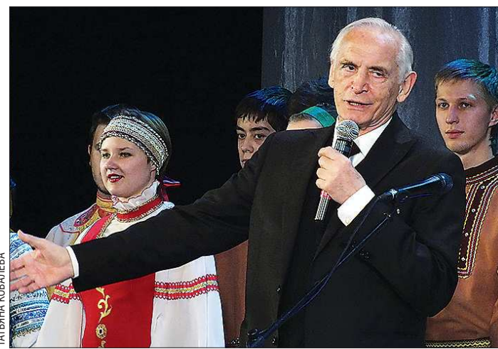
Василий Лановой рассказал, как вместе с театром Вахтангова каждый день лет приезжал в Свердловск с большими гастролями, а жил артисты всегда в гостинице «Большой Урал»

— Да, Павел Корчагин не был религиозным человеком. Он просто и бескорыст-