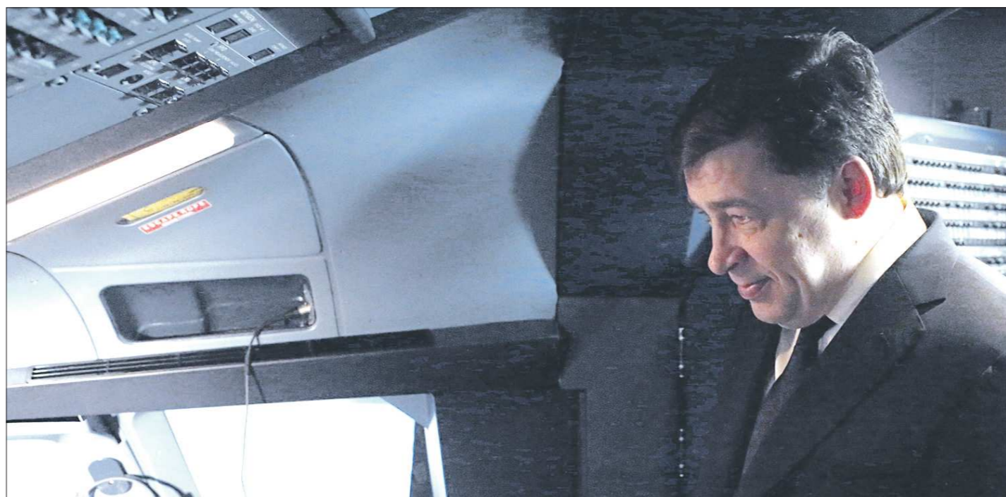
Евгений Куйвашев остался доволен условиями подготовки лётчиков