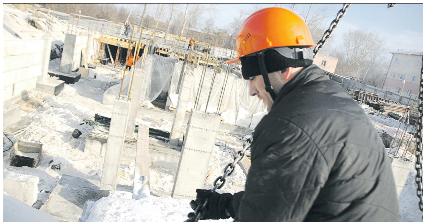
Строители обещают к середине мая завершить возведение монолитных конструкций

– Компенсируем снижение за счёт других инвестиционных поступлений, – подчеркнул губернатор. – Объём иностранных инвестиций в прошлом году вырос в 1,7 раза – это хороший показатель. Все планы по реализации начатых проектов сохраняются. В противном случае компании, вложившие средства, их потеряют. В 2014 году объём иностранных инвестиций, по нашим прогнозам, продолжит расти.