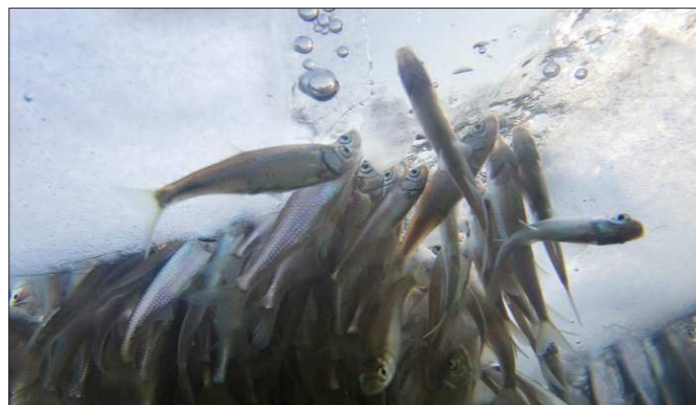
Ближе к весне рыба рада любой трещинке во льду, чтобы глотнуть кислорода

Финансирование подпрограммы будет продолжено и в дальнейшем, вплоть до 2020 года – за это время социальные выплаты получат те, кто уже стоит в очереди. На сегодня число семей, заявивших о желании участвовать в этой программе, более пяти тысяч. Будем надеяться на то, что когда все они получат социальные выплаты, правительство области разработает новую программу, ведь многодетных семей становится на Среднем Урале всё больше.