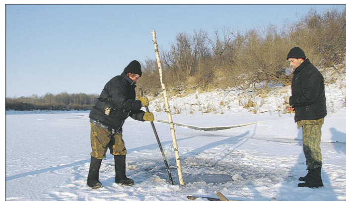
Помочь ей выжить могут вот такие нехитрые проруби