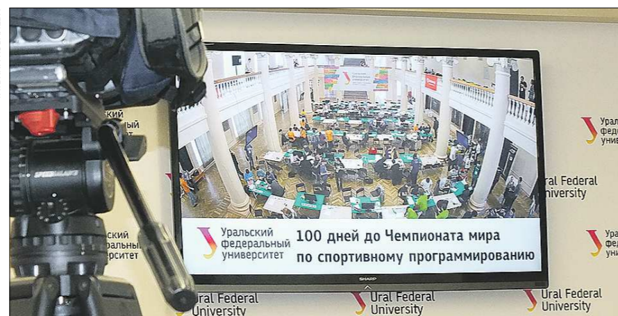
Пресс-центр открыли в аудитории бывшего УрГУ потому, что здесь учатся математики-программисты, и журналисты. А на мониторе – холл УрФУ, где проходит 1/4 финала