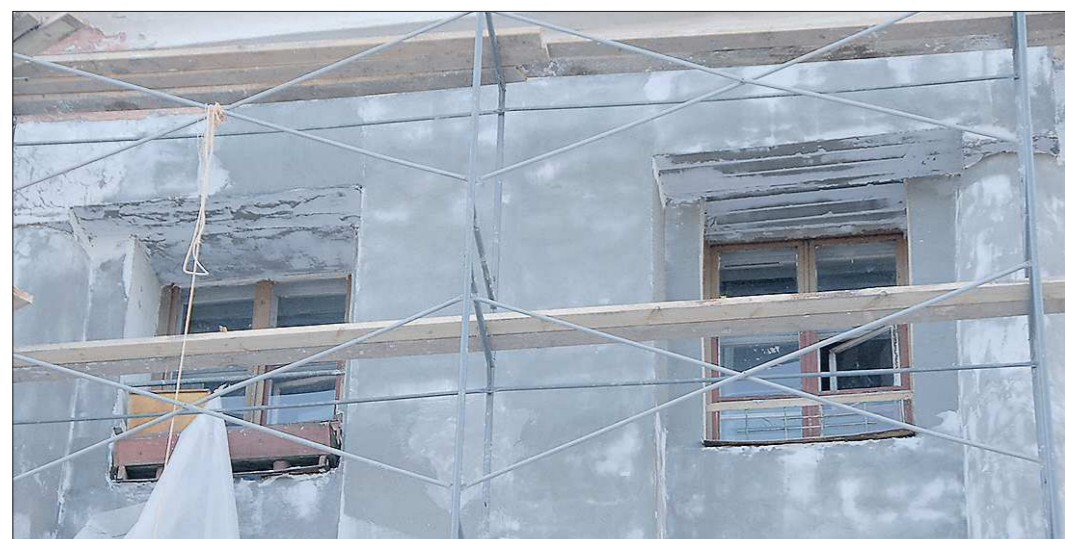
Преимущество в получении бюджетных субсидий отдаётся домам, жильцы которых своевременно собирают взносы на капремонт