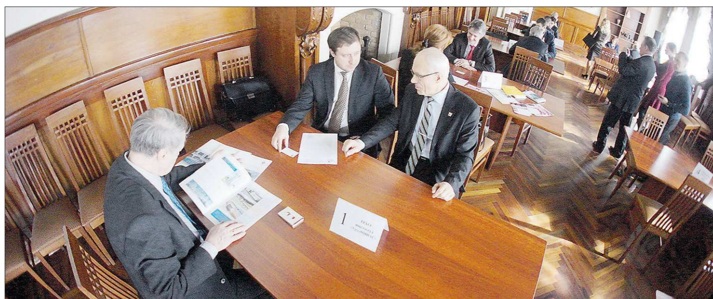
В «Бирже контактов» приняли участие более 60 представителей предприятий и бизнес-сообществ Свердловской области и Санкт-Петербурга

Пользуясь случаем, он обратился к депутатам с просьбой разработать какой-то закон, решающий эту проблему на региональном уровне. Депутаты обещали подумать.