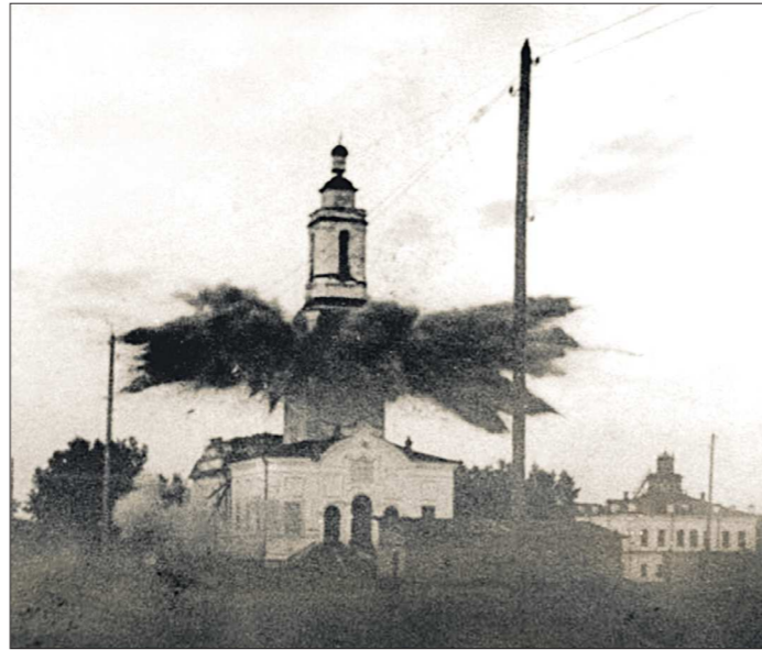
Неизвестный фотограф в 1936 году запечатлел момент обезглавливания Симоно-Аннинского храма

Проект Турчианов подобрал в Санкт-Петербурге по своему вкусу. Собор был построен двухъярусным. Одна его часть — многоэтажная колокольня, вторая же была увенчана шатровым куполом и короной с золотым крестом. Росписи стен внутри храма делались по эскизам Кар-