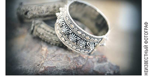
Бен Цион Давид создаёт изысканные ювелирные украшения с помощью инструментов своих предков