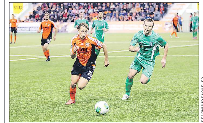
Если бы футболисты «Урала» с самого начала играли так, как весной, они бы сейчас боролись за призовые места

Выбор «ОГ»: Если бы все вопросы по участию баскетболисток «УГМК» в финале премьер-лиги чемпионата России были сняты, то, бесспорно, мы бы остановили свой выбор на женском баскетболе. Но пока «УГМК» де-юре ещё не в финале, порекомендуем футбольный матч «Урал» — «Томь». Напомним, что футболисты «Урала», находясь на 13-м месте в турнирной таблице (опять же без учёта вчерашней игры с «Амкармом») борются за то, чтобы выйти из зоны стыковых матчей. «Томь» отстаёт от екатеринбуржцев всего на три очка и занимает место строчкой ниже. Так что предстоящий матч — просто-таки очная дуэль за место под солнцем премьер-лиги.