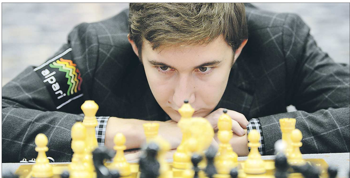
Один из лидеров клуба «Малахит» на чемпионате России был московский гроссмейстер Сергей Карякин

... А в мистическом, но так реалистичном Макондо, наверное, не прекращается дождь. Скорбят о писателе — во всех мирах.