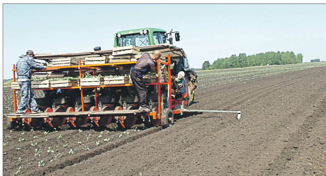
На фоне отставания с севом практически по всем культурам в этом году опережающими темпами идёт посадка капусты, на 23 мая рассадой занято 178 гектаров. По сравнению с этой же датой прошлого года — почти на треть больше

— На 23 мая у нас засеяно 86 процентов площадей, это на уровне прошлого года. Думаю, что к концу недели мы закончим основную сев, у нас останется посеять часть кукурузы,