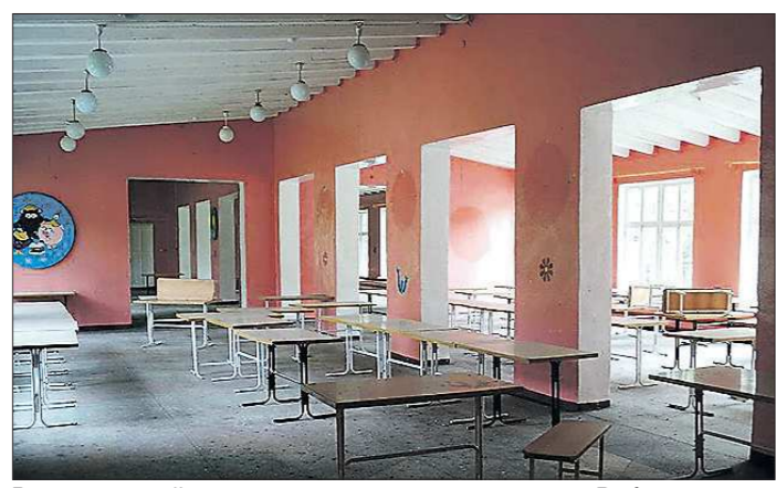
Вот уже пятый год корпуса загородного лагеря «Рябинушка» простаивают, хотя могли бы принимать детей на отдых

Шумные вереницы автобусов сегодня потянулись из Нижнего Тагила за город: в десяти лагерях стартует вторая смена. Но поправить здоровье на свежем воздухе сможет лишь каждый пятый тагильский школьник, мест катастрофически не хватает. Между тем в пригороде без дела уже пятилетку ветшают два самых больших оздоровительных лагеря — «Рябинушка» и «Лесная сказка».