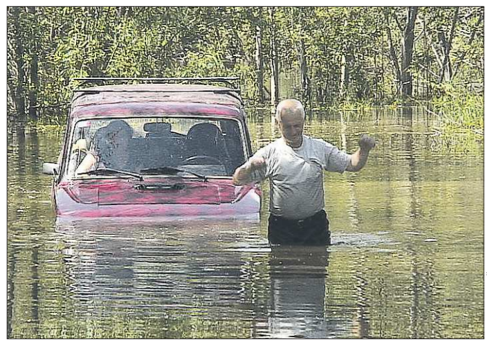
В начале лета самодельную плотину в Волчёвке смыло, и из села пришлось выбираться почти что вплавь