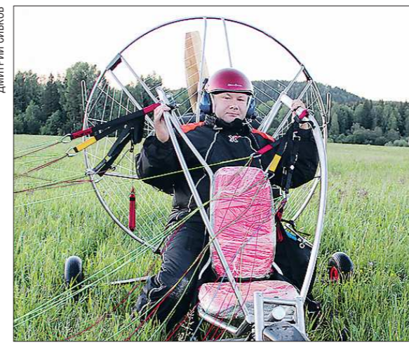
Паралёт — моторный сверхлёгкий летательный аппарат с крылом парашютной конструкции. Пилот (а также двигатель) располагаются на специальном тележке. Для разбега нужна ровная площадка без рытвин и кочек