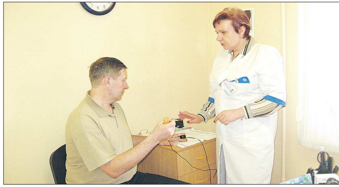
На осмотр у педиатра даётся 9 минут, на заполнение документов и мытьё рук — ещё 4,5 минуты. Приём терапевта в целом должен занять 15 минут, врача общей практики — 18 минут