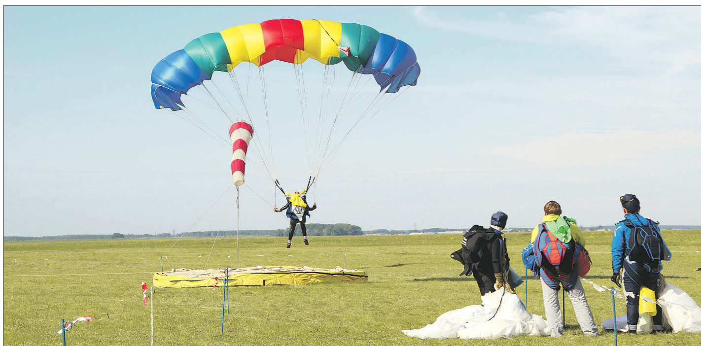
Нынешние соревнования собрали более 60 парашютистов со всей России и Казахстана