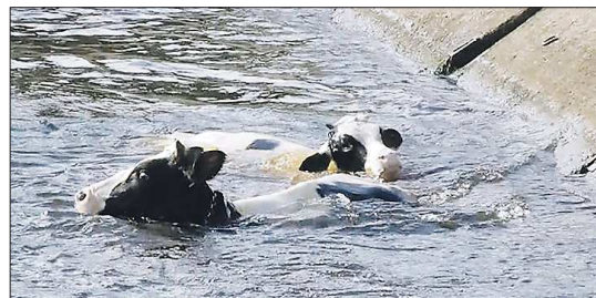
Как две коровы забрели в городской пруд, оказавшись в опасной близости от глубокой канавы, неизвестно