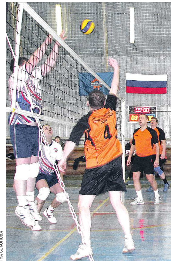
Этот недавний матч со сборной Верхней Туры по волейболу горнозаводские мэры проиграли — сказались отсутствие ведущих игроков. Но обижаться главы не стали и отдали базу маленькому спортивному муниципалитету

Сейчас в городе есть пункт проката лыж. Он находится в центре города. Любители спорта мечтают, чтобы новая лыжная база была построена поближе к природе — на кромке леса и пруда. Их желание скоро исполнится. Сегодня администрация города занята подбором типового проекта, его привязкой к выбранному участку. После доработки проектной документации муниципалитет подаст заявку на участие в областной программе строительства спортивных сооружений. Как объяснил туринцам министр физиче-