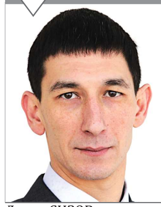
Денис СИЗОВ, депутат Законодательного Собрания Свердловской области