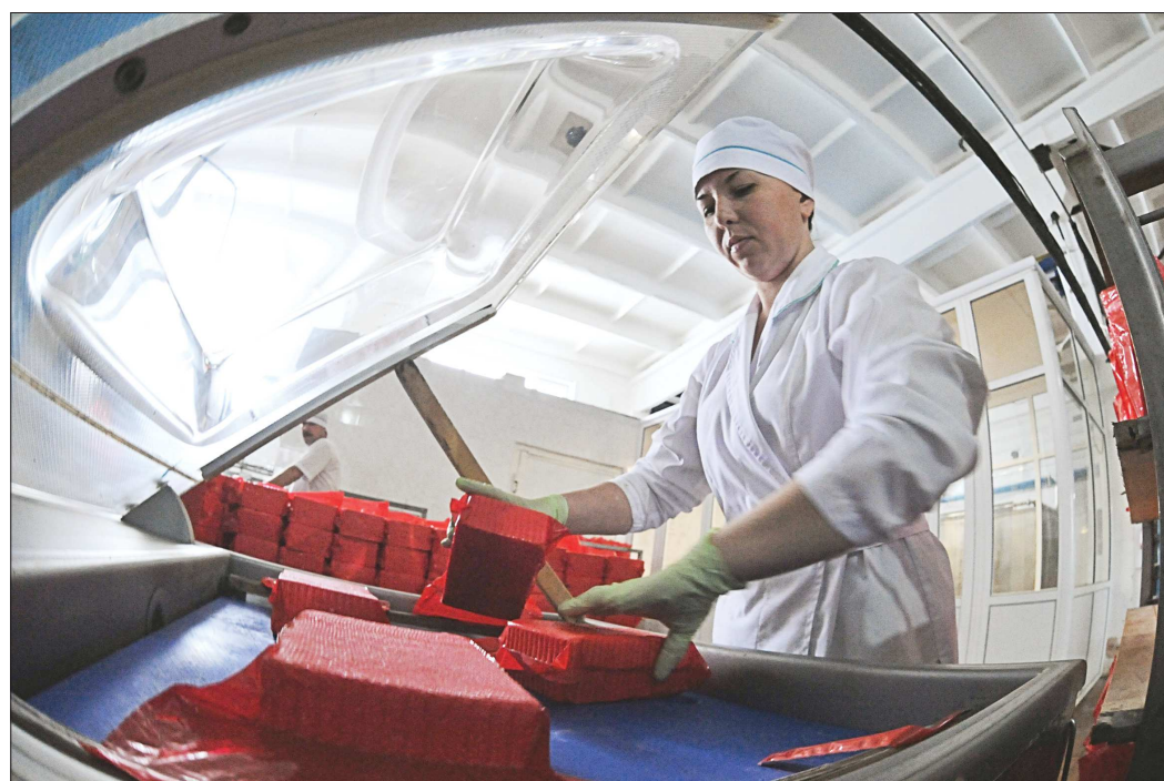
Производство полутвердых сыров «Российского» и «Муромского» в Байкаловском филиале Ирбитского молзавода наладили ещё в 2001 году

На сегодня ирбитчане производят 20 тонн сыра в месяц, и это не основная их