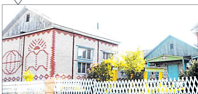
В 2015 году в Хабарчихе не будет ни одного первоклассника. В посёлке понимают, чем это грозит местной школе