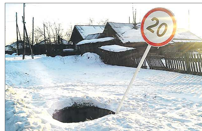
Некоторые знаки в Сосьве просто не закреплены, это, например, стоит в колодце