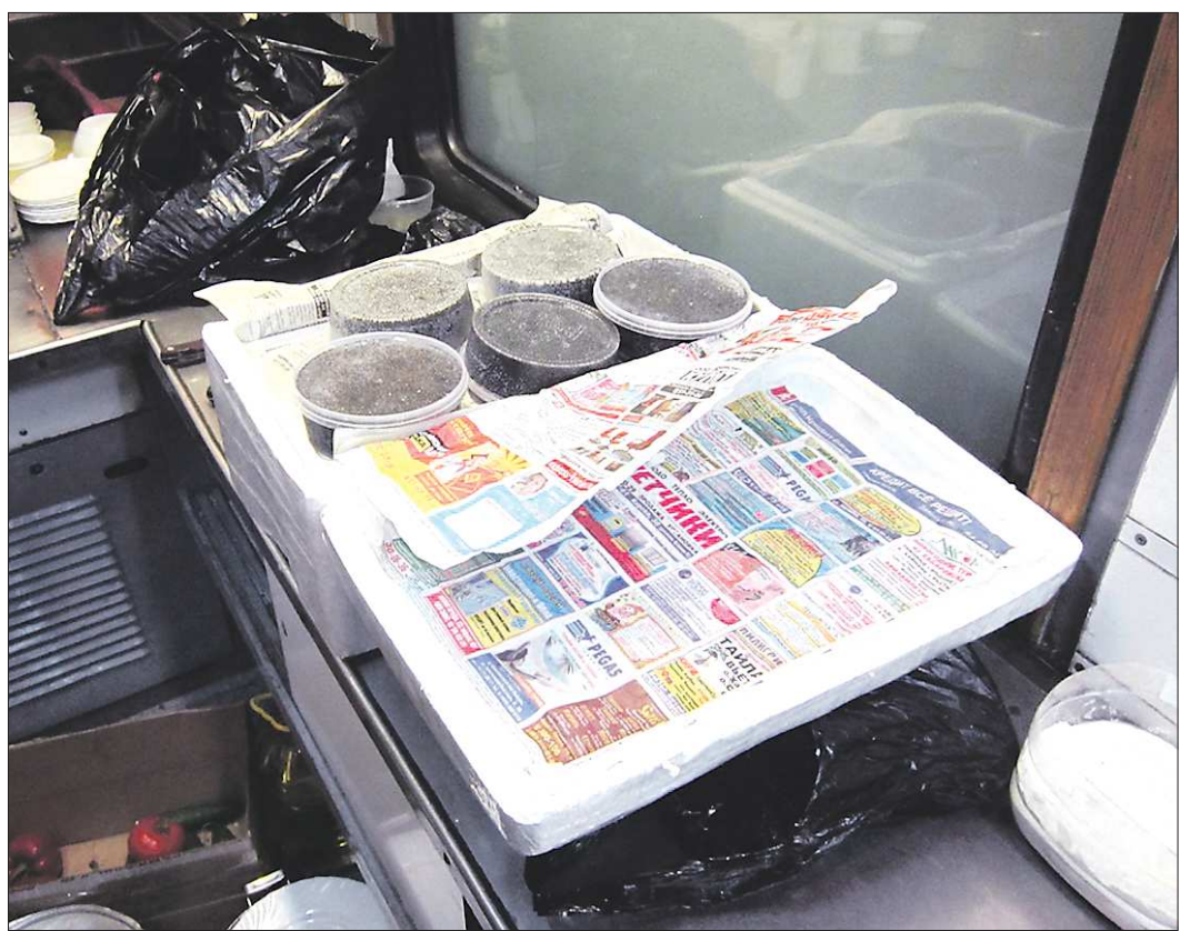
Откуда взялась и кому предназначалась браконьерская икра, предстоит выяснить следствию

– А «Областную»? – тут при чём? – не менее удивлённо интересуется женщина. – Вашу газету курьер всегда кладёт в ящики. Здесь несколько