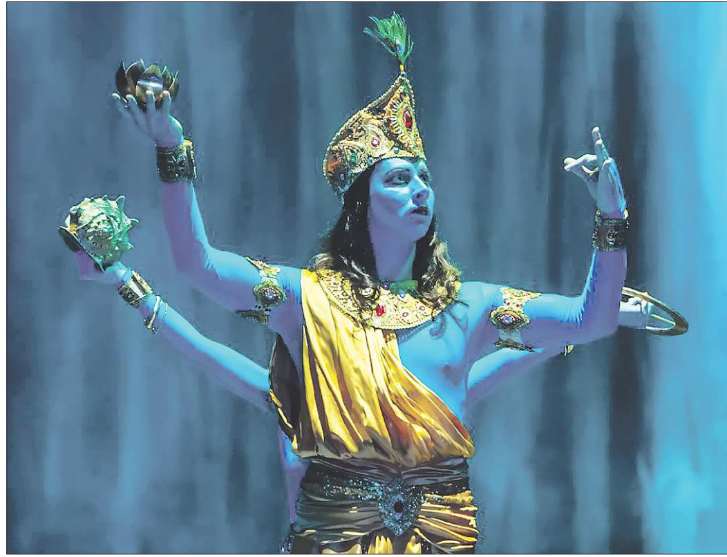
«Сатьяграха» — самая необычная и яркая премьера года. Опера написана на санскрите, но даже и мысли не возникало перевести её — для облегчения восприятия — на русский, поскольку вместо привычных в оперном жанре речитативов, арий, диалогов здесь звучат мантры (в основе либретто — текст «Бхагавадгиты»)

В Ирбите создана первая в мире экспозиция, оснащение которой позволяет выставлять гравюры более чем на четыре месяца. Началось всё