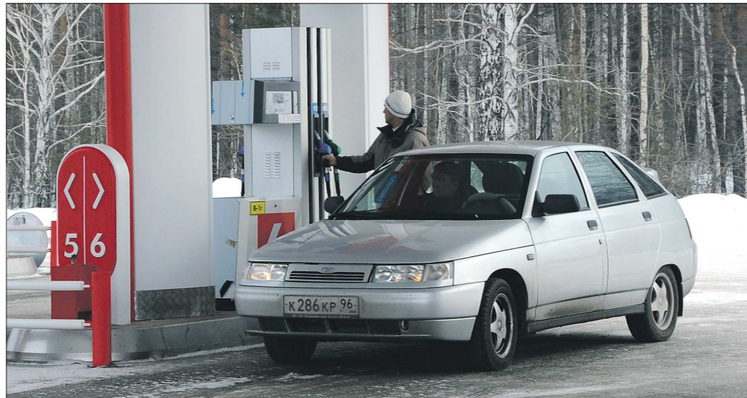
После увеличения акциза бензин для автолюбителей станет дороже как минимум на три рубля

С 1 января на 5,5 процента проиндексирован размер большинства социальных пособий в Свердловской области. Изменения касаются ряда выплат из федерального и регионального бюджетов. По данным областного министерства социальной политики, единовременное пособие при рождении ребенка с учетом регионального коэффициента вырастет до 17,4 тысячи рублей. Минимальный базовый размер ежемесячного пособия по уходу за первым ребенком, которое в 2014 году составляло 3,1 тысячи рублей, в 2015 году превысит 3,3 тысячи рублей. Пособие по уходу за вторым и последующими детьми вырастет с 6,3 до 6,5 тысячи рублей.