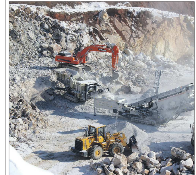
Мрамор, добываемый на Ново-Ивановском карьере, является составной частью сухих строительных смесей

В прошлом году горнодобывающая компания «Эверест», расположенная в Полевском, приступила к выпуску сухих строительных смесей — штукатурки и шпаклёвки для наружных и внутренних работ, клея для укладки керамической плитки, наливных полов и составов для кладки строительных блоков.