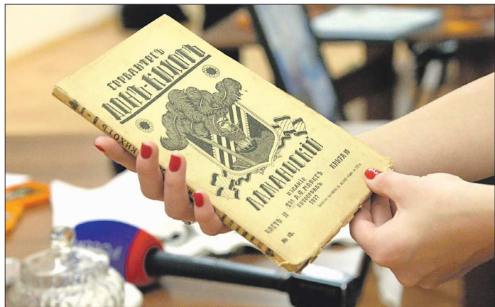
Отдел редкой книги краеведческого музея вчера пополнился ещё одним раритетом - книгой Мигеля де Сервантеса «Дон Кихот» издания 1917 года

В следующем раунде Кубка вызова «Уралочка» предстоит отправиться либо на Лазурный берег в Ле-Канне, либо на греческий остров Наксос. Дома «Паннаксико» выиграл у «Роввилла» со счётом 3:0, вчера вечером во Франции состоялась ответная игра.