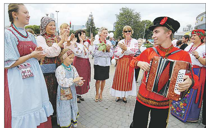
День народов Среднего Урала был учреждён в регионе в 2002 году. В 2013 году его празднование было перенесено с апреля на сентябрь и стало по-настоящему массовым

— В пример могу поставить Берёзовский, Верхнюю