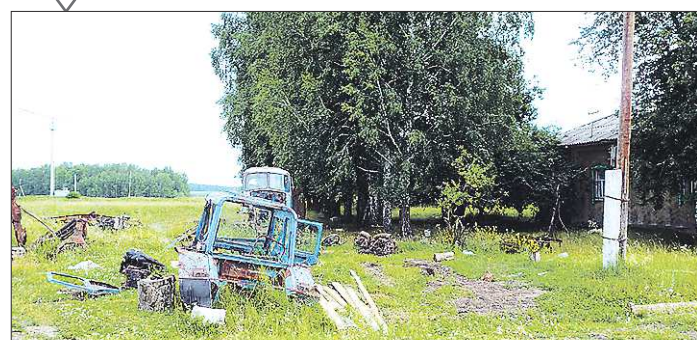
Единственное напоминание о колхозе в талицкой Ивановке — ржавые остатки сельхозтехники