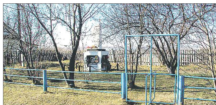
Перед митингом ко Дню Победы жители Слободотуринской Ивановки облагораживают скверик возле памятника участникам войны

— Периодически в деревне вспыхивали крестьянские волнения, а после революции