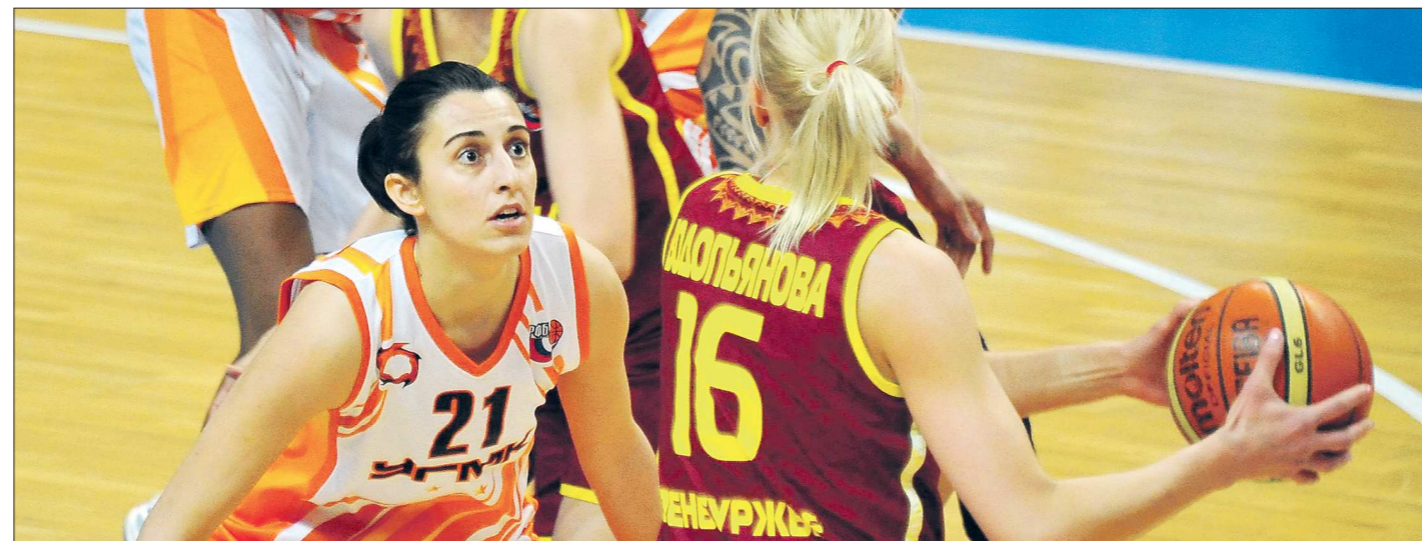
Когда ещё такое бывало — за весь первый матч «лисицы» ни разу не вели в счёте!

— А я не полностью. Про музеи, заметьте, я сам сказал — но в конце... Потому что всё-таки библиотека должна быть более открытой, нежели просто «музей книги». Здесь должно постоянно что-то происходить. Книгохранилище — лишь одна из функций.