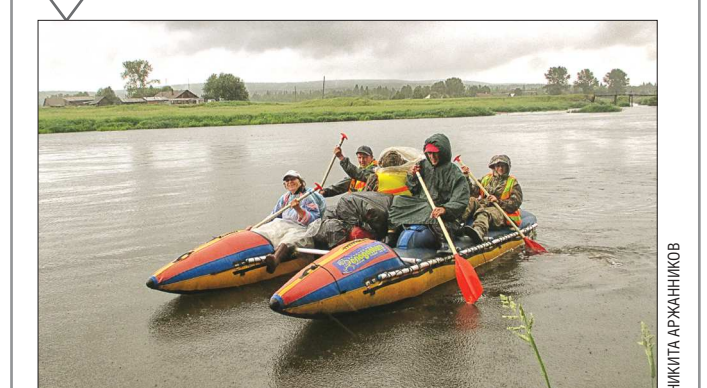
Даже среди молодёжи не каждый рискнёт отправиться в сплав по Чусовой, но вот пенсионеров из турклуба пожилых граждан Октябрьского района (Екатеринбург) бурная река не испугала. В июле они устроили двухдневный сплав на катамаранах.

Несмотря на проливные дожди и похолодание, ни один из участников не отказался от похода.