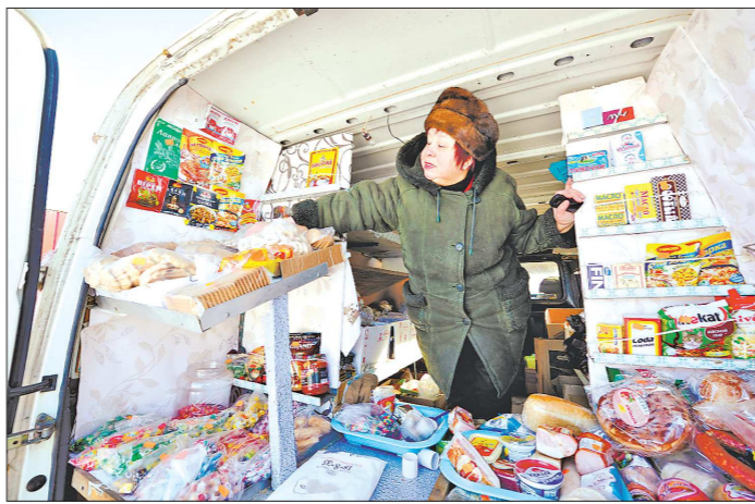
Иногда «на колёсах» встаёт целый универсам: можно купить и сметану, и мыло, и корм для кошек

Но больше всего автолавок нужны жителям отдалённых селений, где нет магази-