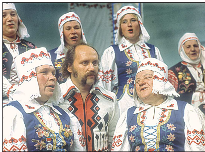
Основатель ансамбля «Песняры» Владимир Мулявин (в центре) во время встречи с артистами самодеятельного ансамбля народной песни из белорусского местечка Березино.

6 крупных картофелин, одна луковица, 2-3 яйца, соль и перец по вкусу. Картошку натереть на терке, причем не самой мелкой, важно делать это вручную.