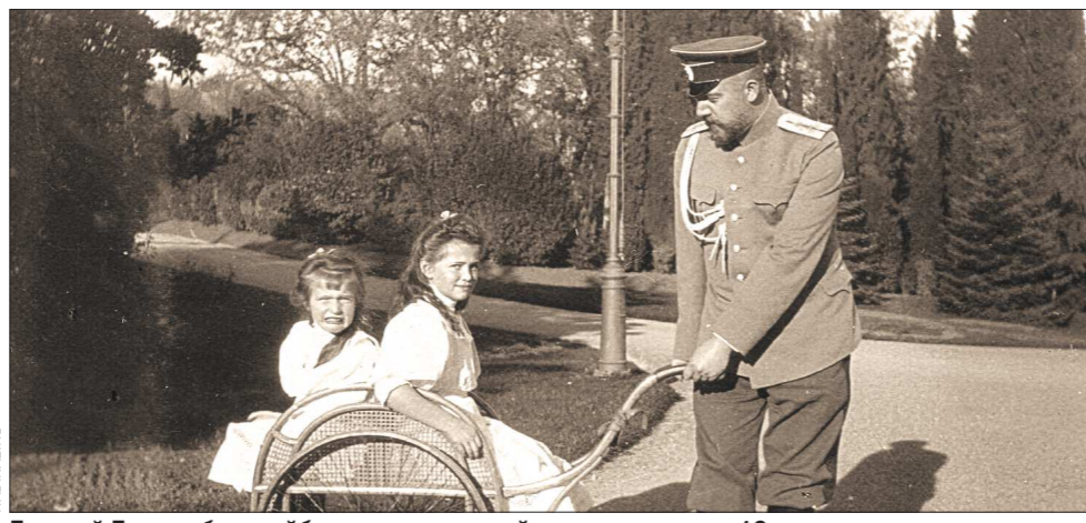
Евгений Боткин был лейб-медиком царской семьи в течение 10 лет и находился рядом с великими князьями Марией и Анастасией с самого их детства

В 2015 году проект «Живая история» превратился во всероссийский интернет-ресурс, уникальный для нашей страны. Все желающие могут участвовать в конкурсах на этом сайте, а учителя - делиться своими методическими разработками.