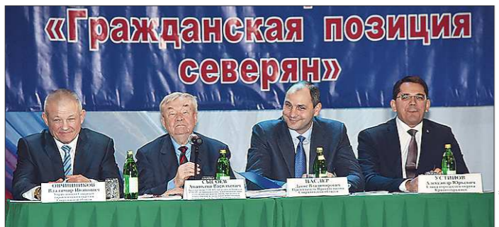
Денис Паслер: «Гражданская позиция северян» сможет объединить разных людей

+/- — рост / падение по отношению к предыдущему показателю