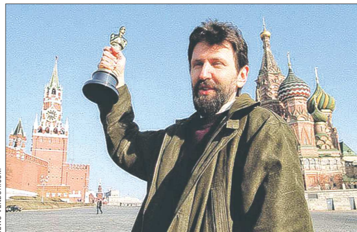
тебе не нужна, ты можешь её продать только академикам за сумму ровно в 1$. Раньше было так. Сейчас не знаю, к сожалению... А статуэтка стоит на полке с другими наградами и пылится. Гости приходят и просят с нею сфотографироваться. Я не отказываю.