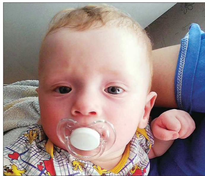
Может быть, кто-то узнает ребёнка, коляску и поможет найти его родственника