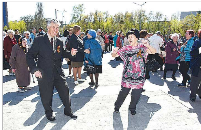
Под песни военных лет ноги сами идут в пляс