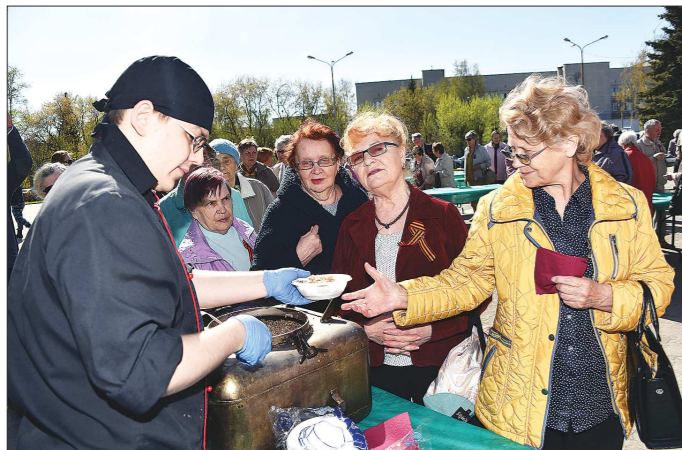
За солдатской кашей выстроилась очередь, но голодным никто не остался