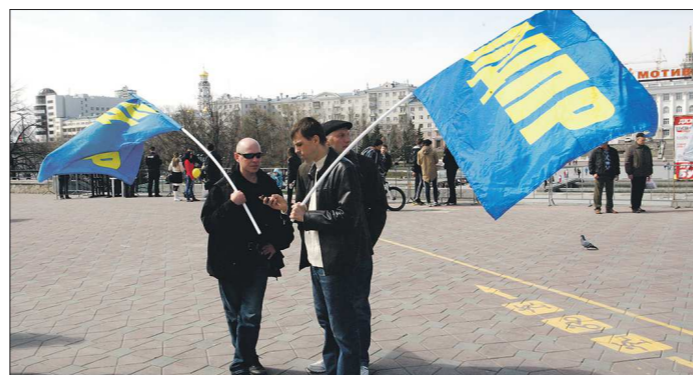
Нового местного руководителя свердловские либерал-демократы ждут уже полгода