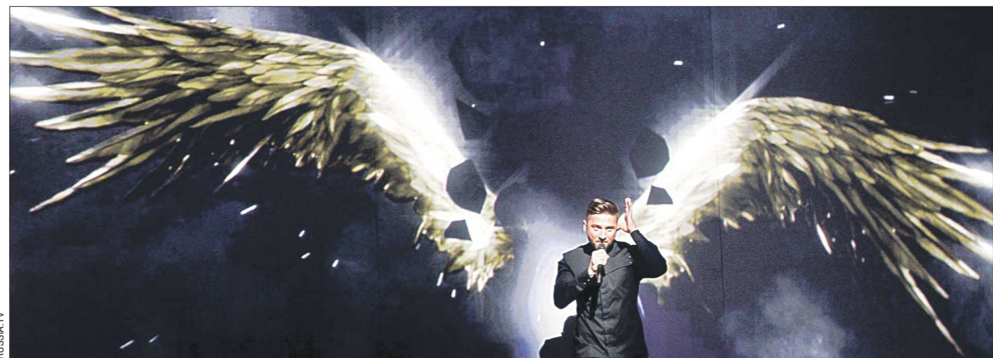
На сцене стокиоской арены «Эрикссон-Глоб» Сергей Лазарев представил номер, который смотрелся даже сильнее, чем снятый на эту же песню клип

– Я надеюсь, что подтянусь до вашего уровня когда-нибудь, – отметил Владимир Путин , награждая свердловских хоккеистов. – Буду стараться наращивать мастерство. А вам хочу пожелать успехов.