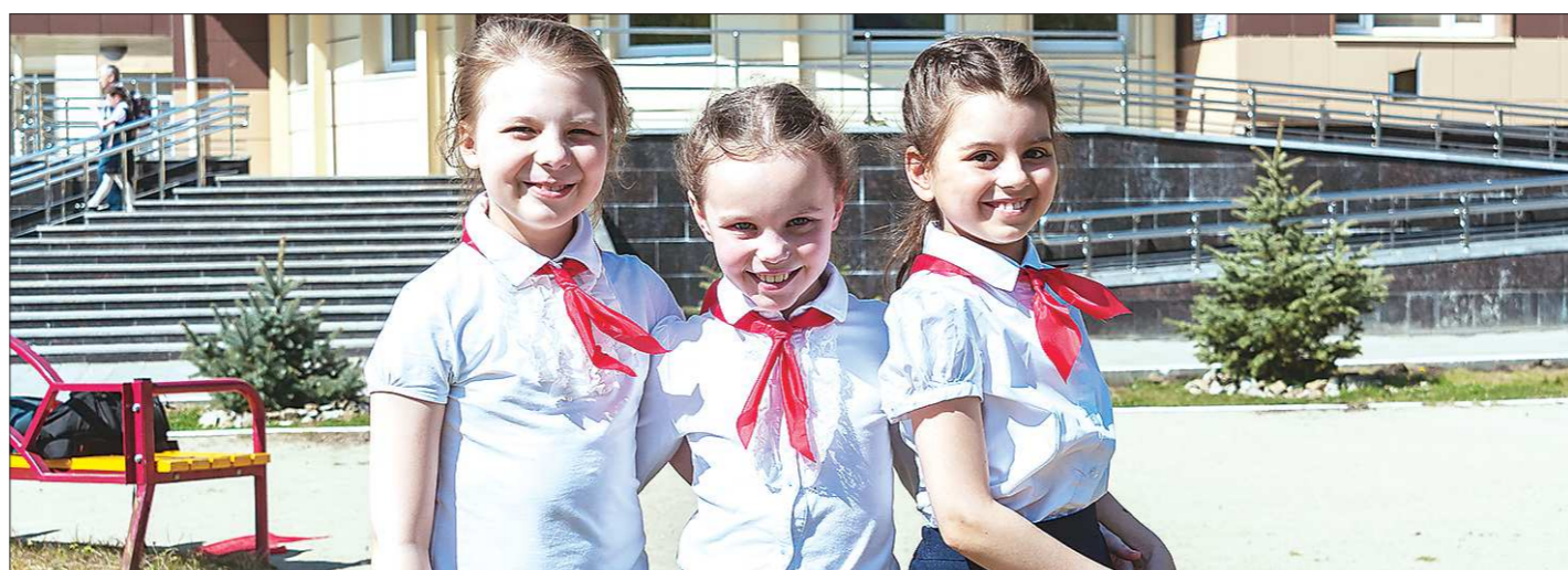
Не исключено, что символика РДШ будет похожа на пионерскую — красные галстуки в нашей стране до сих пор ассоциируются с детством

— Уже пять лет эпидемия ВИЧ во всём мире идёт на спад, — в завершение встречи сказал Мишель Казачкин. — Сегодня её развитие отмечается лишь в странах Восточной Европы и Азии — конечно, ВИЧ пришёл сюда лет на 10 позже. Однако сегодня мы имеем действенные средства борьбы с ВИЧ и можем успешно предотвратить его распространение. Сразу после Екатеринбургa я отправлюсь в Иркутск, затем буду в Казани и Петербурге. К борьбе с ВИЧ надо подходить общественными организациями.