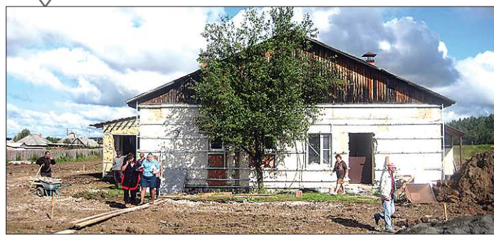
Сдачу объекта опять перенесли — теперь уже на 22 июня