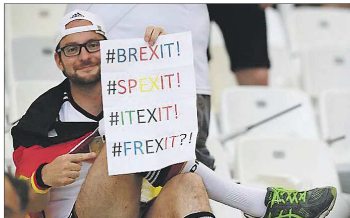
Болельщик сборной Германии связал политические и футбольные новости, но не угадал — вслед за Англией, Испанией и Италией футбольную еврозону покинула Германия, а не Франция

Интересная деталь — до стадии полуфиналов признанные фавориты, планомерно продвигаясь по турнирной сетке, были как бы в тени. Горячо обсуждали с одной стороны выскочки — Исландию и Уэльс, с другой — провал Англии, не-