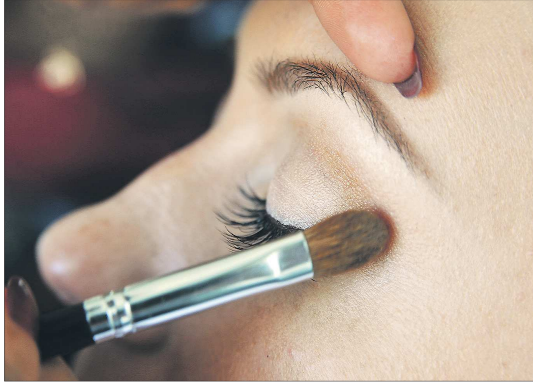
Любому цвету глаз подойдут оттенки «золото» и «бронза»

Ну и, конечно, отдельно нужно сказать о вечернем макияже. Ведь лето — это ещё и пора свадебных торжеств, выпускных балов и весёлых вечеринок.