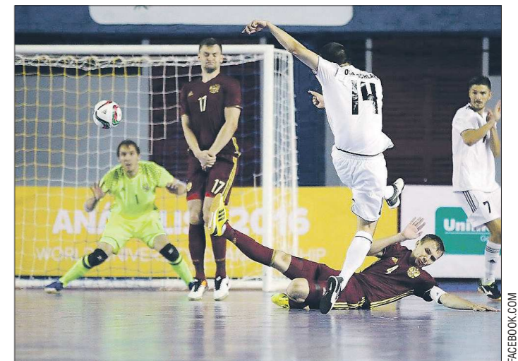
Немецкая сборная много атаквала. Но «уральская защита» не дала возможности сопернику забить больше двух мячей