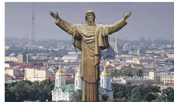
Общая высота монументального произведения (вместе с 50-метровым постаментом) должна составить 83 метра. Это почти на 50 метров выше знаменитой статуи Христа-Искупителя в Рио-де-Жанейро