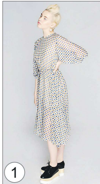
1 Siamm Siamm основан в 2011 году

В этом году «Сиамм» предлагает сдержанные, без ярких цветов и с прямыми линиями платья — как отмечают са-