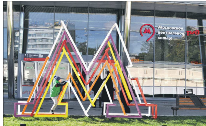
Железная дорога и метро полностью синхронизированы. Даже время работы совпадает – с 5:30 утра и до часа ночи

жайшем будущем по кольцу хотят запустить экскурсионный «Исторический поезд».