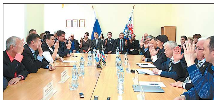
Участники совещания единогласно проголосовали за создание совета и кандидатуру руководителя