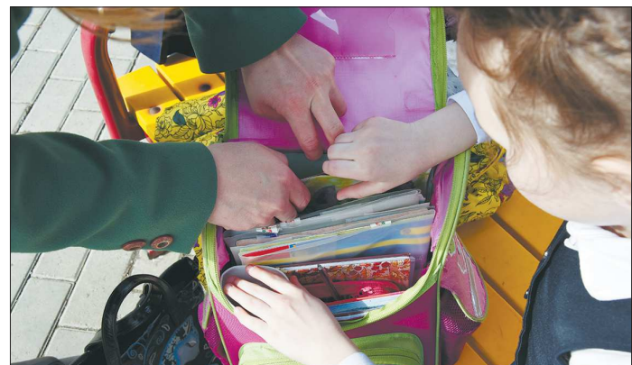
Вопрос о том, есть ли в портфеле дневник, становится неактуальным: оценки родители узнают благодаря его электронной версии