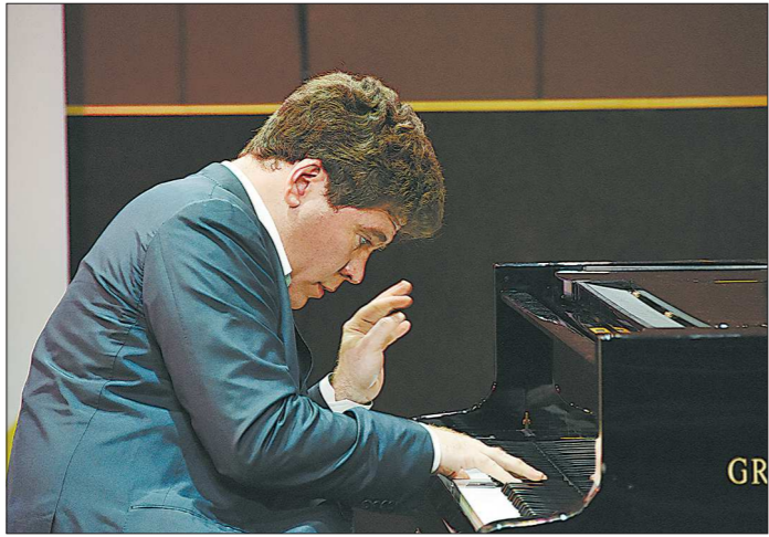
Далеко не каждому городу выпадает такая удача — фестиваль Дениса Мацуева. Это, безусловно, одно из самых ожидаемых мероприятий лета

● Коляда-Plays. 20-30 июня. Из года в год Коляда-Plays — одно из самых ярких событий лета. Это уже традиционный для Екатеринбурга Международный фестиваль современной драматургии, куда съезжаются театры со всей страны и