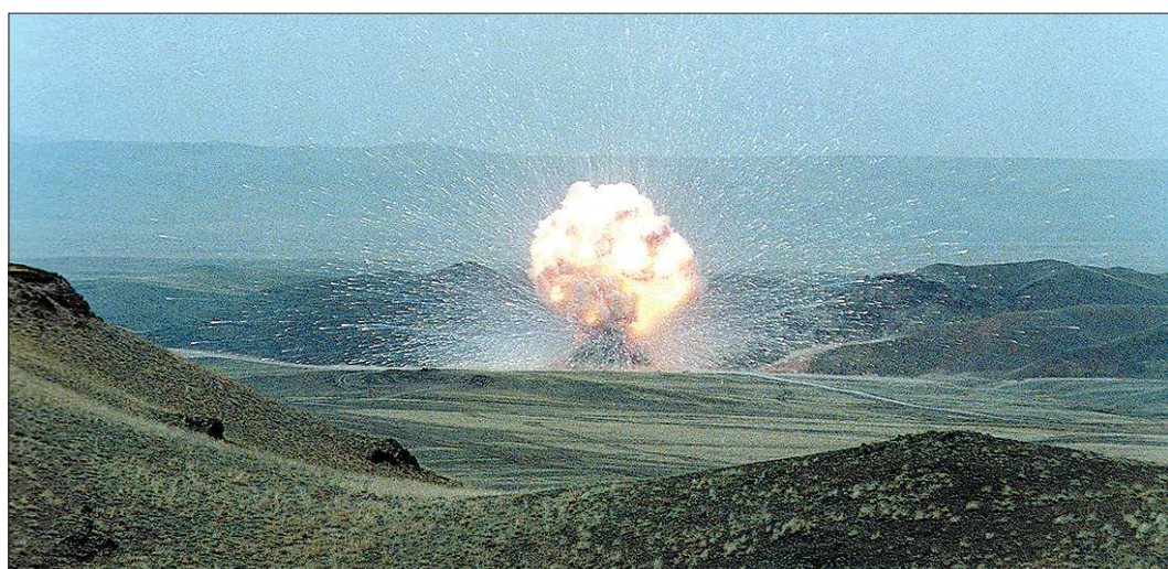
Ядерный гриб на Новой Земле, выросший над сопкой 2 августа 1987 года, вошёл в историю — его снимок хранится у многих свидетелей того события

В июне 1962 года перед выходом на учения в Атлантике на нашей лодке произошла разгерметизация трубопровода. Устраняли аварию, стоя по колено в радиоактивной воде. Ввели в действие энергоустановку за две суток, и на учения успели. В 1964 году во