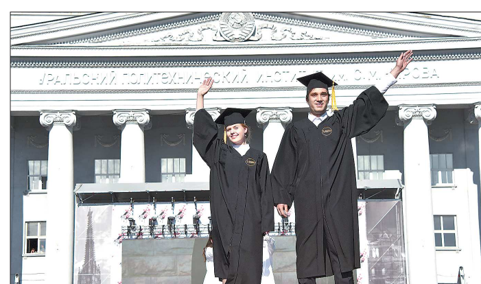
Учёные уверяют, что после получения самостоятельности легче защититься в УрФУ не станет

— Если раньше люди заходили в поисковую строку адрес сайта, то сейчас это происходит всё реже. Люди смотрят СМИ в соцсетях, и неправильно заставлять их переходить по ссылкам на сайт. Они листают ленту Facebook в поисках информации, но даже не запоминая, кто был источником — им и это уже неважно. Соцсети убили веб-ресурсы, как когда-то веб-ресурсы убили газеты. Веб как платформа перестанет существовать. Хотя сегодня посещение сайтов растёт именно за счёт переходов с социальных сетей.