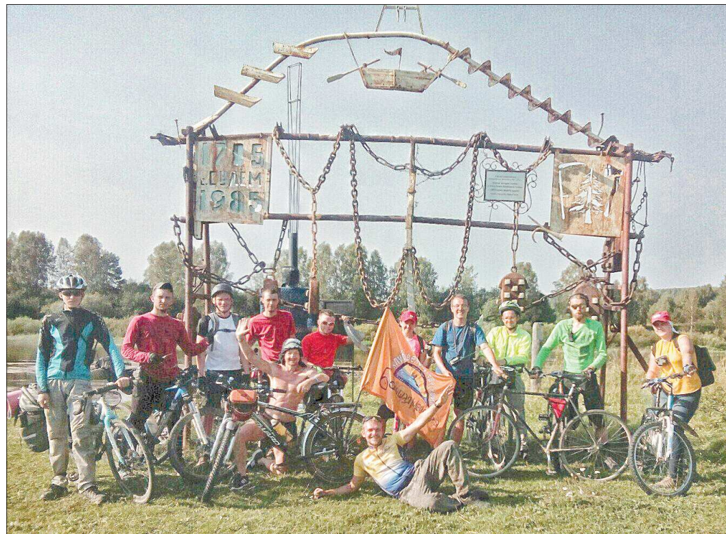
Фото краеведов на память в Музее под открытым небом Сулём на фоне железной рамы, на вершине которой вырезана лодка с вёслами, символизирующая село

В деревне Усть-Утка участники побывали в музее «Русская горница». Здесь сотни кукол: обережные, обрядовые (для свадьбы или сватовства) или просто демонстрационные костюмы разных народов Урала. Яркие, нарядные. Попутно с костюмами для кукол здесь же шьются полноразмерные наряды – велосипедисты с большим любопытством примерили на себя одежду разных эпох и послушали рассказы о быте людей, живших на Урале в стародавние времена. В музее школы села Чусовое ребятам показали картинную галерею уральских художников, а также рассказали о значимости села во времена «железных караванов» – речной флотилии, осуществлявшей грузовые перевозки в европейскую часть России с металлургиче-