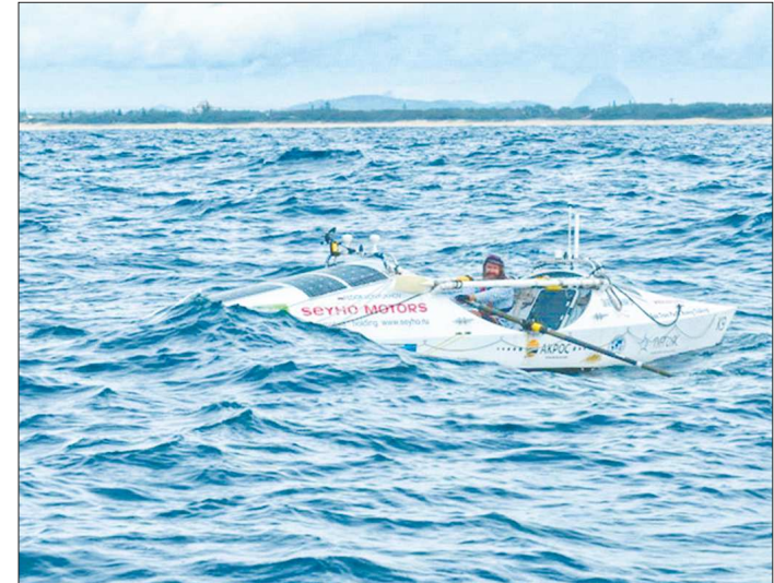
В 2014 году Фёдор Конохов на вёсельной лодке «Тургойк» пересёк самый большой океан на планете – от континента до континента – без заходов в порты, без посторонней помощи за рекордное время