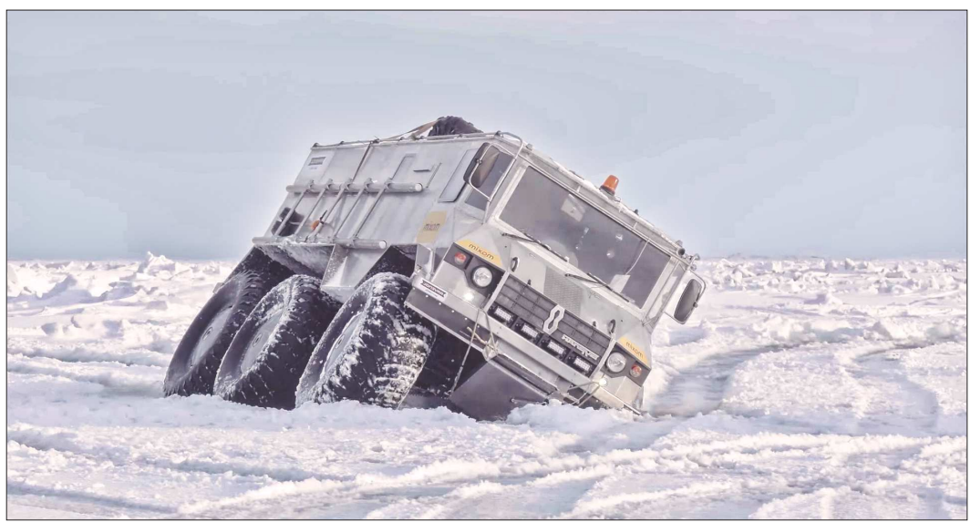
В экспедиции участникам пришлось преодолевать множество трудностей. Одна из них – рыхлый снег. Провалиться легко, но вот достать 3,5-тонную машину – большая проблема