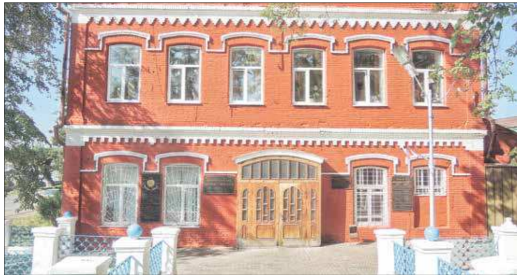
Старинное здание заводоуправления до сих пор одно из самых запоминающихся в городе

– На завершающий этап вышли две программы технического перевооружения предприятия. Это модернизация кузнечно-прессового цеха и реконструкция корпуса механического цеха. Техническое перевооружение участка штамповки заго-