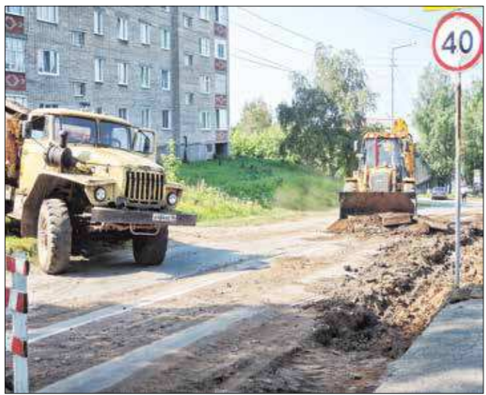
На протяжении лета в центре Верхней Туры активно идут дорожные работы