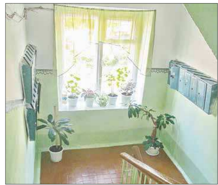
На окно повесили шторы, поставили комнатные цветы – получилось по-домашнему уютно и красиво

Вот такой урок воспитания чистотой получился у педагога. Ведь в чистом, ухоженном, по-домашнему уютном подъезде рuko не поднимется бросить мусор, что-то написать на стене. И пусть бережное отношение к подъезду как к части своего жилища станет для всех нас обычным и привычным делом.