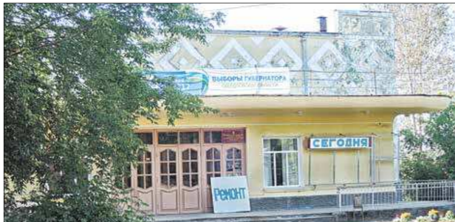
Кинотеатр запустят осенью этого года

В реализации намеченных планов нам помогают ГК «Ростех», региональное минпромторг. Верю, что мы общими усилиями построим новое высокотехнологичное производство.