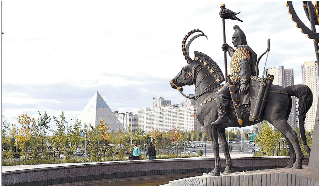
В Астане уверены: Екатеринбург в борьбе за ЭКСПО вооружён всем необходимым

В Астане (Казахстан) завершилась Международная специализированная выставка ЭКСПО-2017, которую за три месяца посетило почти четыре миллиона человек. Учитывая, что Казахстан стал первой страной в СНГ, которая приняла на своей территории столь масштабное мероприятие, выставочную площадку для обмена опытом неоднократно посещали делегации из России. Екатеринбург претендует на проведение всемирной выставки в 2025 году — со 2 мая по 2 ноября. Казахстанские коллеги уверены: победа в борьбе за ЭКСПО даст городу новый толчок к развитию.