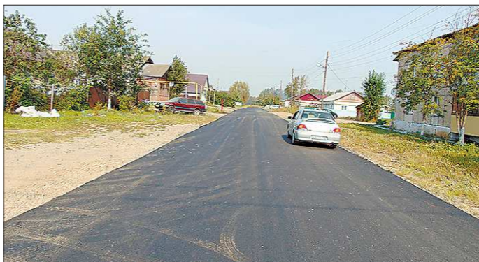
Теперь главные улицы Покровского заасфальтированы не только по документам