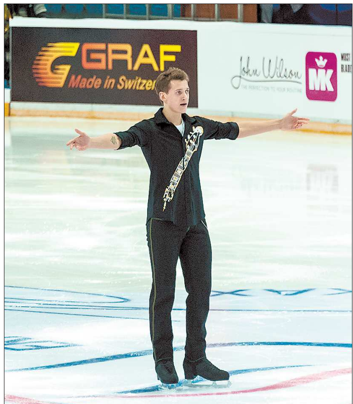
Максим Ковтун откроет сезон на турнире «Финляндия трофи» (один из этапов мирового Гран-при) в Хельсинки с 6 по 8 октября

Олимпиада в Сочи четыре года назад для многих запомнилась именно фигурным катанием — триумф наших девочек-одиночек заставил обратить на себя внимание. Тем более, что одна из звезд Сочи — Юлия Липницкая — свердловчанка. На подходе — Игры в Пхёнчхане. Российские фигуристы на днях открыли сезон, представив на льду сочинского «Айсберга» новые программы на открытых прокатах перед руководством федерации. И уже можно сделать первые выводы: каковы шансы наших фигуристов на предстоящих Играх? Будем ли мы, загнав дыхание, следить за головокружительными полётами надо льдом? И какие перспективы у свердловчан на Играх-2018?