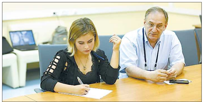
Юлия Липницкая встретилась с руководителями Федерации фигурного катания России и написала заявление о выводе её из состава сборной страны

нее время боролась с анорексией. Сейчас у неё в планах — понять, чем ей хочется заниматься. Но... даже если бы она официально не завершила карьеру, соперничать за место в сборной с претендентами на олимпийское золото Пхёнчхана она бы не смогла. Надо сказать, за четыре года женское фигурное катание совершило колоссальный прорыв. С теми программами, с которыми Юлия и Аделина Сотникова выигрывали олимпийское золото, сегодня девушки остались бы вне пьедестала. Конечно, на открытых прокатах внимание было приковано к Евгению Медведевой, которая за последнее время собрала полную коллекцию титулов. Не хватает только одного — самого главного. На чемпионатах Европы и мира Медведева близко ни-