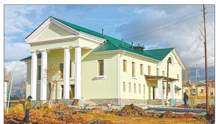
Новый фасад в малахитовой цветовой гамме. Теперь Дом культуры «Малахит» оправдывает своё название