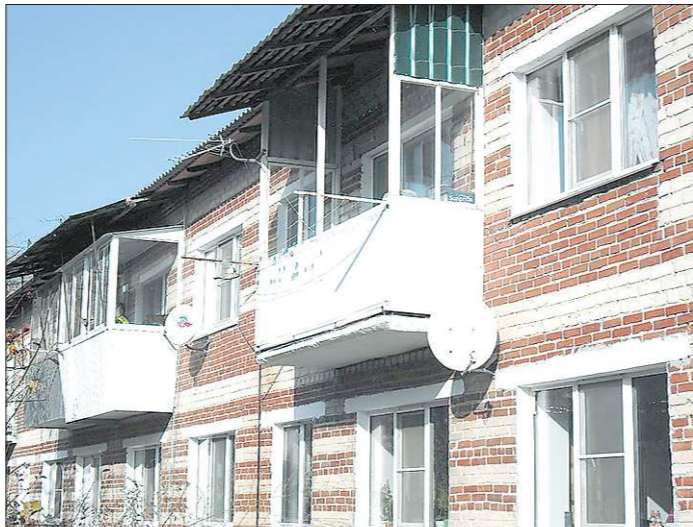
В капремонте в Арамиле нуждается целый список домов, но платить за проведение работ хочется не всем

В 2018–2020 гг. в Арамиле запланирована «перезагрузка» ещё четырнадцать домов. Так, в следующем году она коснётся пяти объектов: дома №21 по улице Строителей, №27 на Декабристов,