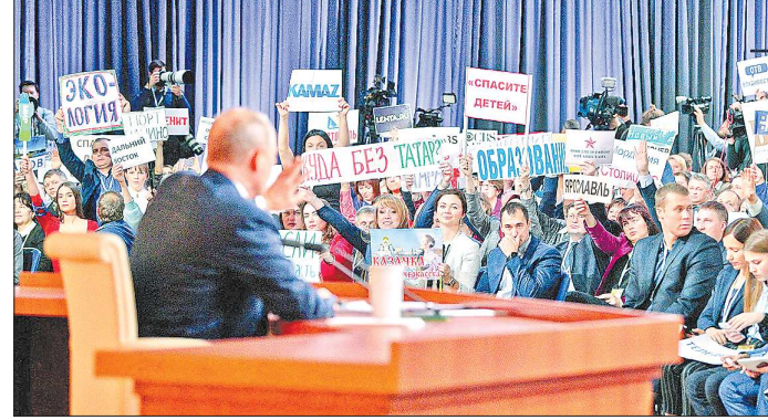
Несмотря на предельно допустимый размер плакатов А3, нескольким журналистам удалось пронести большие растяжки. На плакатах указывали тему, СМИ или регион

В четверг на пресс-конференцию президента собралось рекордное количество журналистов, что существенно снизило шанс напрямую обратиться к главе государства. Разговор с Владимиром Путиным многим запомнился скорее не самими вопросами-ответами, а эпатажем журналистов. «ОГ» следила за ходом пресс-конференции по обе стороны экрана.